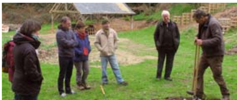
Jardin au naturel / 18 mars Les signataires de la charte ont participé à un atelier pour préparer le jardin avant le printemps.