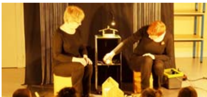
Des maisons à découvrir / 15-16 mars Les enfants de 0 à 3 ans ont pu découvrir tout un univers de drôles de maisons.