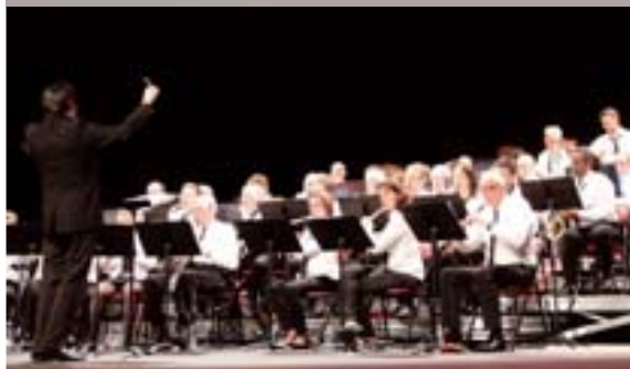
Concert annuel / 25-26 mars Les musiciens de l'Harmonie Saint-Michel ont tenu leur concert annuel à Cap Nort.