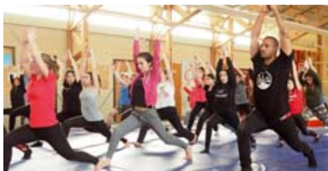
Raging Bull / 29 mars Atelier de hip-hop proposé aux lycéens dans le cadre du spectacle Raging Bull à Cap Nort.