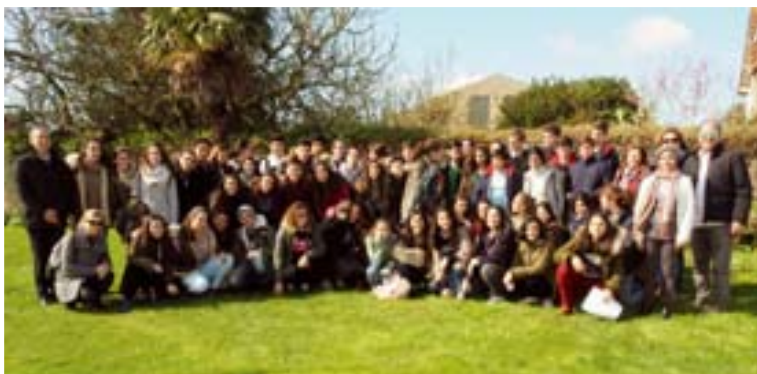
Accueil de classes / 24 mars 58 élèves espagnols en échange avec le collège Paul Doumer ont été reçus en mairie.