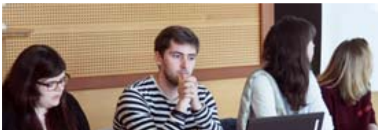
City Centre Doctor / 13 mars Les étudiants du Master 2 "Villes et Territoires" ont présenté leur diagnostic à M. le Maire et ses adjoints.