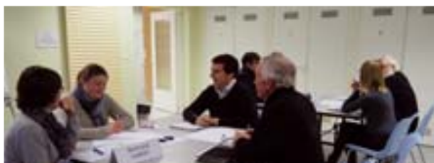
Conseil intergénérationnel / 13 mars Les membres du Conseil intergénérationnel réfléchissent à l'organisation d'une journée citoyenne.