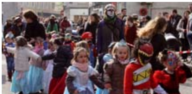
Carnaval des enfants / 25 mars Les enfants de l'école Sainte-Jeanne d'Arc ont défilé dans les rues du centre-ville.