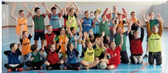
Foot en salle / 23 octobre Un tournoi qui a réuni 27 jeunes de l'AJICO, Sports Vacances, le Centre jeunesse de Petit-Mars et l'Adapei.