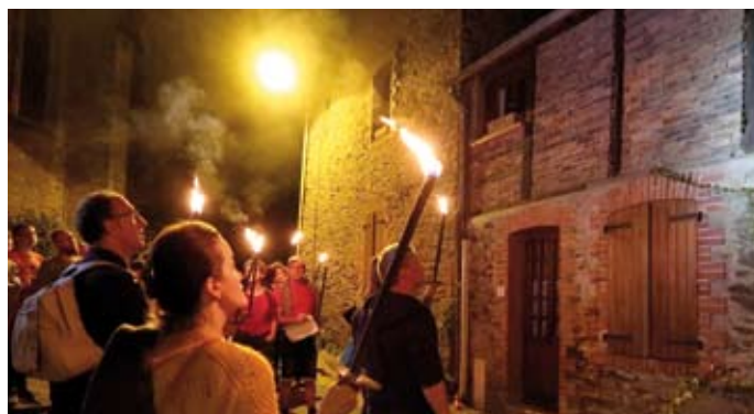
Journées du Patrimoine / 21 septembre Une belle randonnée aux flambeaux pour redécouvrir le centre-ville et ses secrets.