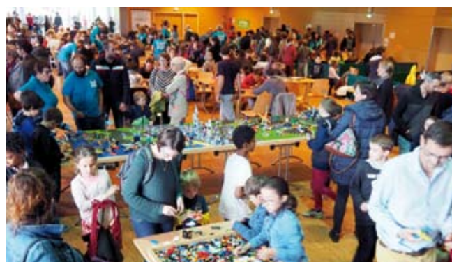
Cap Jeux / 19 octobre Une troisième édition réussie pour Cap Jeux qui a accueilli environ 800 personnes.