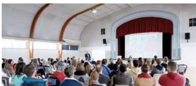
Accueil des nouveaux arrivants / 12 octobre 120 nouveaux Nortais étaient présents pour découvrir la commune et rencontrer les élus.