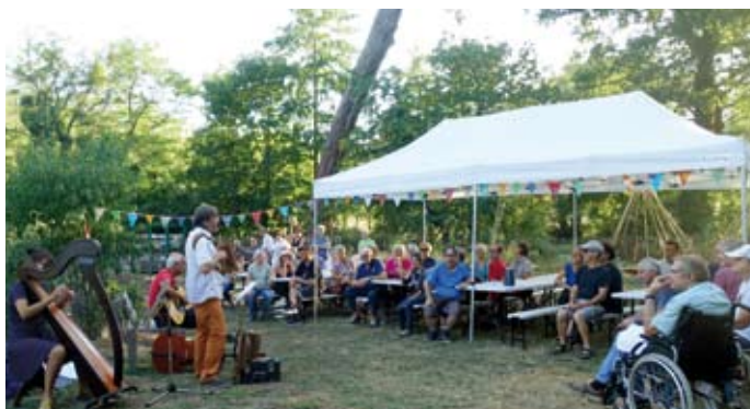
Soirée festive Al'terre Nort / 14 septembre Soirée de pleine lune au jardin partagé de La Garenne. Succès pour cette 2 ème édition.