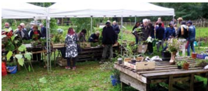
Troc plantes / 20 octobre Les jardiniers étaient au rendez-vous pour le troc plantes d'automne au jardin de La Garenne.