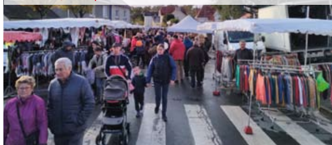
Foire Saint-Martin / 11 novembre Une fréquentation en hausse, du public comme des commerçants, pour cette édition.