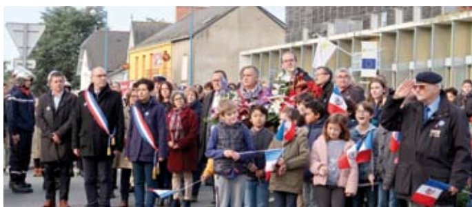
Commémoration / 10 novembre De nombreux Nortais se sont réunis pour la commémoration de l'Armistice 1918.