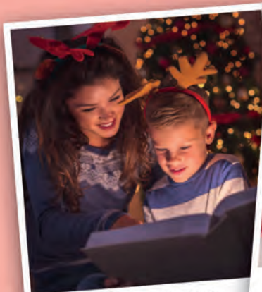
HEURE DU CONTE ET PROJECTION

DES ANIMATIONS GRATUITES POUR TOUS DANS LE CENTRE-VILLE ET À LA MÉDIATHÈQUE