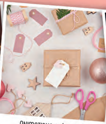
ANIMATIONS CRÉATIVES ET MUSICALES