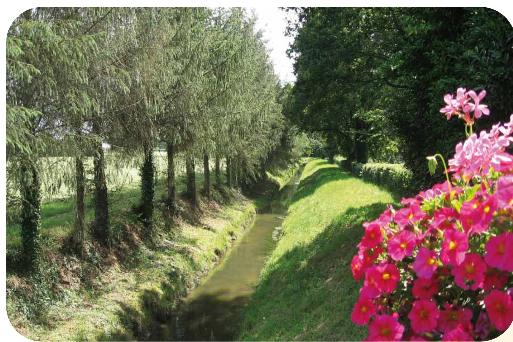
Circuit du Petit Canal