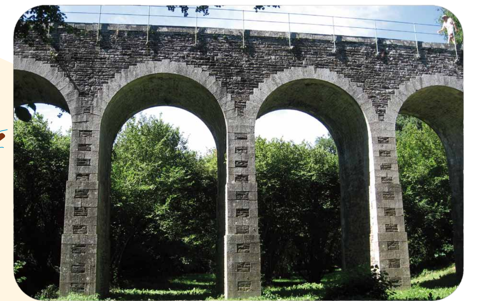
Circuit des Arcades