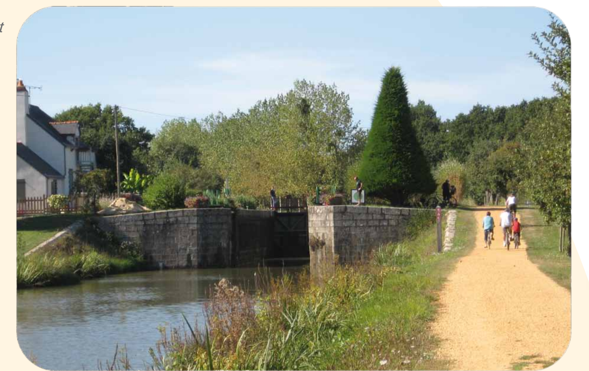
Circuit de l'Ecluse du Pas d'Héric