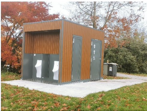
Toilettes mises à disposition sur les lieux